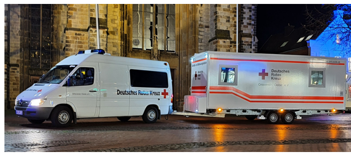
Unsere mobile Sanitäts- und Betreuungsstation Unsere moderne „Sanstation“ kam in den vergangenen Jahren oft zum Einsatz – so bei Großveranstaltungen und als mobile Corona-Teststation in Städten des Kreises Warendorf.

Der landesweite Bedarf an lebensrettenden Bluttransfusionen ist hoch. Mitglieder unseres Arbeitskreises Blutspende helfen dem DRK-Blutspendedienst West bei Terminen in Oelde und Lette – bei der Organisation, der Registrierung von Blutspenderinnen und Blutspendern und bei der Zusammenstellung und Ausgabe von Essenspaketen nach der Spende.